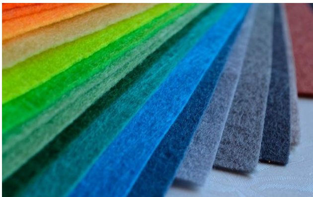
Так выглядит листовой фетр

Фетр является универсальным материалом, очень прост в использовании, он плотный, отлично держит форму и имеет различные расцветки, причем, одинаковых оттенков с обеих сторон, его не обязательно сшивать, можно клеить и создавать различные игрушки и развивающие пособия. Люди, которые занимаются рукоделием, по достоинству его оценили. Фетр не мнется и не портится, так что при создании картины не нужно временить, решая, какой материал выбрать.