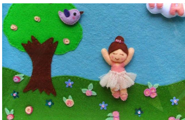
Панно детское

Сделать панно из фетра самостоятельно очень просто. Для этого нужно лишь выбрать необходимые материалы и инструменты, а также найти подходящие выкройки.